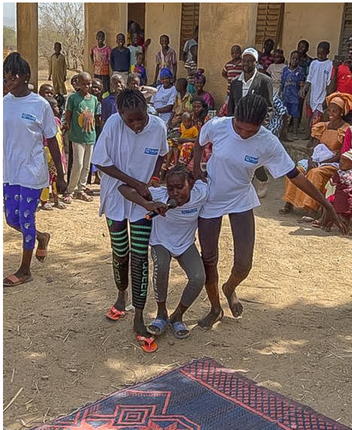
Schüler:innen zeigen einen Sketch zum Thema FGM/C

In Mali sind 83 Prozent der Mädchen und Frauen beschnitten. 2 Die Beendigung dieser Praktik ist keine leichte Aufgabe. Die weibliche Genitalverstümmelung/-beschneidung (FGM/C) 3 ist stark mit kulturellen Werten verbunden und dem Glauben vieler Menschen nach religiös verankert. Neben den psychischen Folgen kann sie schwere gesundheitliche Komplikationen nach sich ziehen. Hierzu zählen heftige Blutungen, Infektionen, Schädigungen der Harnwege sowie der reproduktiven und sexuellen Organe. Dabei ist FGM/C ein Tabuthema.