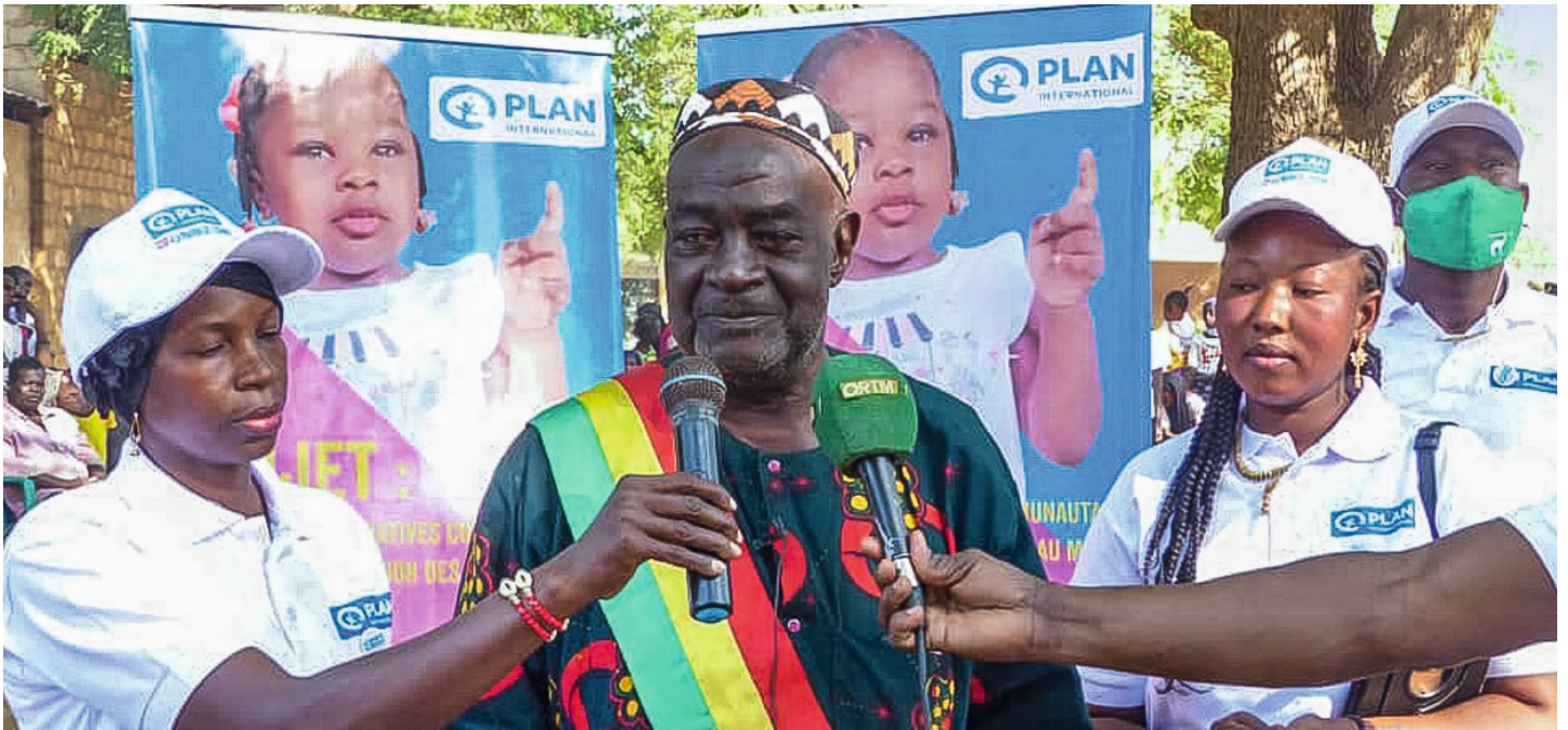
Rede des Bürgermeisters von Oualia am internationalen Tag gegen weibliche Genitalverstümmelung