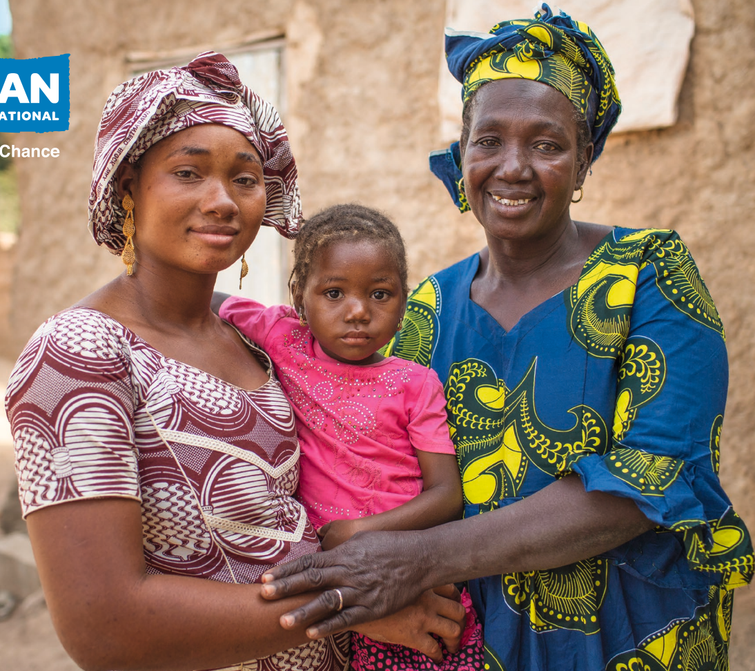
Das Bild zeigt eine Familie, die ihre Tochter nicht beschneiden lässt.