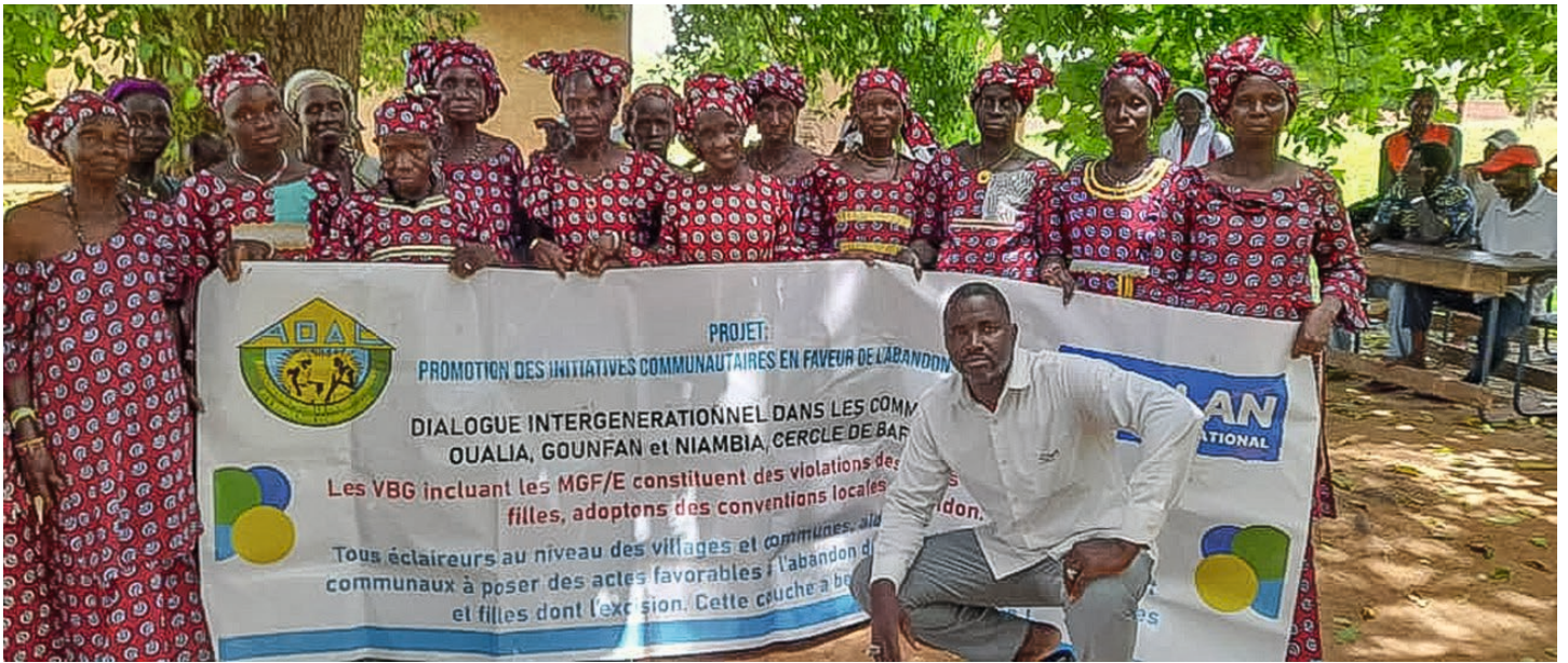
Frauen der Gemeinde Sitakoto bei generationsübergreifenden Dialogveranstaltungen

die Gemeindeleitungen, Bürgermeister, Vertreterinnen von Plan International und Frauengruppen sowie der lokalen Partnerorganisation die offiziellen Erklärungen zur Abschaffung von FGM/C.