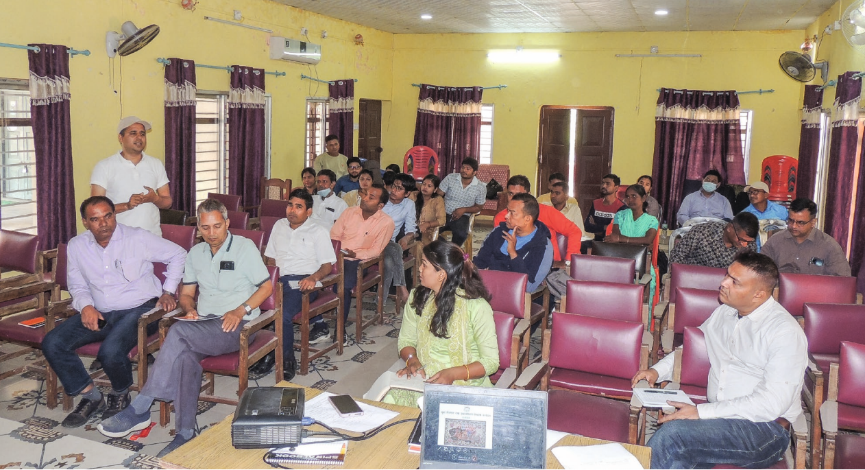
Die Auftakttreffen zum Projektstart gaben einen umfassenden Überblick über die Projektaktivitäten und boten Möglichkeiten für einen regen Austausch