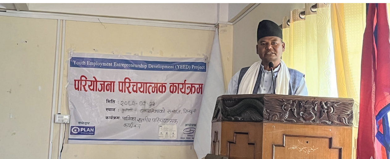
Der stellvertretende Bürgermeister der Gemeinde Dudhauri (Distrikt Sindhuli) bei seiner Eröffnungsrede im Rahmen der Auftaktveranstaltung im April 2023

Der Klimawandel und die Auswirkungen von Umweltkatastrophen sind in den Projektregionen immer deutlicher spürbar. In beiden Projektdistrikten ist es in der Vergangenheit zu Überflutungen und Erdbeben gekommen. Aus diesem