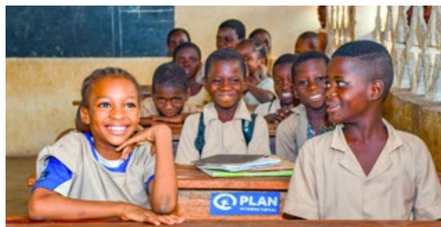
Die Stiftungsfamilie fördert u.a. Bildungsprojekte weltweit – und ermöglicht Kindern damit Zukunftschancen.