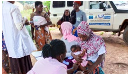
Mit einer mobilen Klinik werden Mütter und ihre kleinen Kinder in abgelegenen Gebieten erreicht.

Im Rahmen unseres aktuellen Projekts „Gesundheit und frühe Bildung für Kinder“ in Togo wurde eine mobile Klinik ausgestattet, die nun regelmäßig in abgelegene Gemeinden fährt und medizinische Versorgung zu (werdenden) Müttern und ihren kleinen Kindern bringt. Denn in unserer Projektregion sind die Wege zu den nächsten Gesundheitsdiensten oft weit und sie können dementsprechend nicht von allen in Anspruch genommen werden. In der mobilen Klinik erhalten Schwangere Vorsorgeuntersuchungen, Kinder werden geimpft und Eltern bekommen Informationen zu Themen wie der richtigen Ernährung ihrer Kinder oder Familienplanung. Um die Kinder- und Müttersterblichkeit in der Projektregion zu senken, wurden zudem 19 Geburtshelfer:innen zu Wiederbelebungstechniken, insbesondere von Neugeborenen, fortgebildet. Damit sie ihr Wissen mit anderen teilen können, erhielten sie Neugeborenenpuppen zum Üben von Reanimationen sowie Infobroschüren. Zu den weiteren Projektaktivitäten gehören der Bau und die Ausstattung von zwei Kindergärten, Schulungen für Eltern zu positiver Elternschaft, Einkommen schaffende Maßnahmen und mehr. Mehr zum Projekt erfahren Sie unter: www.plan.de/stiftungsprojekt-togo