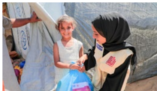
Mithilfe lokaler Partnerorganisationen verteilt Plan International Lebensmittelpakete in Gaza.

Die humanitäre Situation in Gaza ist katastrophal und wird durch die Eskalation des Iran-Konflikts weiter verschärft. Kindern und ihren Familien fehlt es an allem – an Nahrung, Unterkünften, Schutz, Zugang zu Bildung. Die Stiftungsfamilie unterstützt die Nothilfe von Plan International in der Region. Durch die enge Zusammenarbeit mit lokalen Partnerorganisationen war Plan International in den letzten Monaten eine der wenigen internationalen NGOs, die über Ägypten Hilfsgüter nach Gaza bringen konnte. Nachdem die Hilfsgüter die Grenze passieren, werden sie zunächst in ein großes Lagerhaus transportiert. Dort werden handliche Pakete für Familien gepackt – mit Lebensmitteln, Kleidung oder auch Hygieneartikeln. Diese Pakete werden dann von den Partnerorganisationen verteilt. Auch die Ausgabe von warmen Mahlzeiten und sauberem Wasser wird organisiert. Bis Januar konnten so rund 590.000 Menschen im Gazastreifen mit Hilfsgütern versorgt werden. Daneben hilft Plan International mit Maßnahmen im Bereich Kinderschutz, psychosozialer Unterstützung und Bildung. So wurden u.a. temporäre Lernorte errichtet, in denen bisher mehr als 1.000 Kinder ihre Bildung fortsetzen konnten. Das ist wichtig, denn Bildung gibt Kindern emotionalen Halt und legt Grundlagen für eine Zukunft nach dem Krieg. Mehr zur Nothilfe in Nahost erfahren Sie unter: www.plan.de/stiftung-nothilfe-nahost