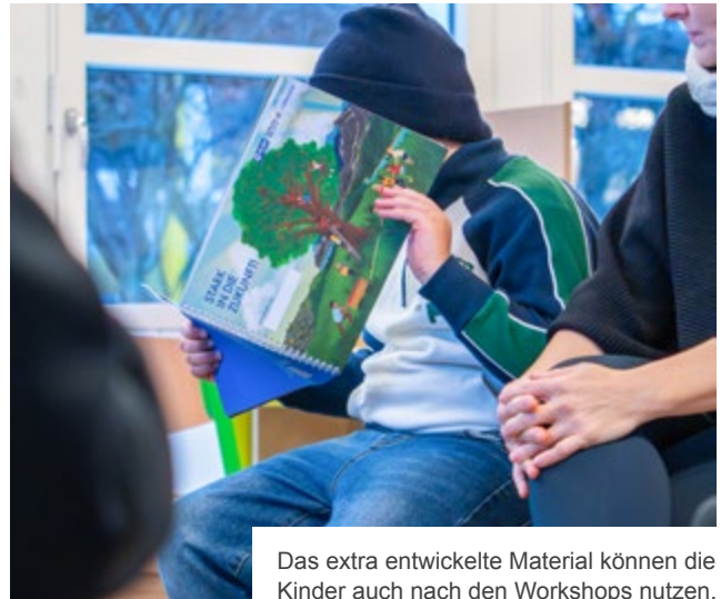
Das extra entwickelte Material können die Kinder auch nach den Workshops nutzen.