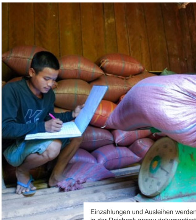
Einzahlungen und Ausleihen werden in der Reisbank genau dokumentiert.