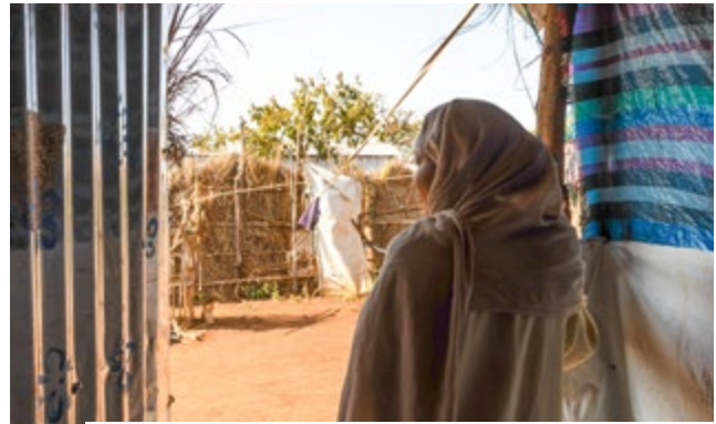
Amina hat auf ihrer Flucht vor dem Krieg in Sudan Gewalt erlebt – und gibt die Hoffnung trotzdem nicht auf.

Sascha Balasko, Referent für Media Relations, reiste im Dezember 2025 mit Journalist:innen nach Ura, um die Öffentlichkeit auf das Leid der Menschen vor Ort aufmerksam zu machen.