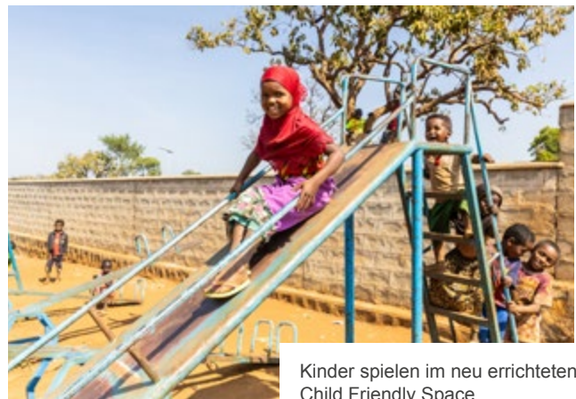
Kinder spielen im neu errichteten Child Friendly Space.