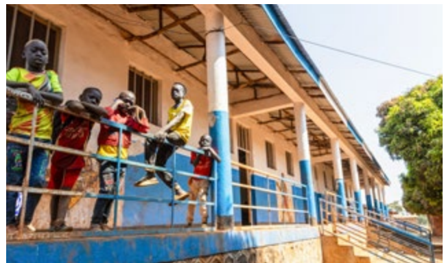
In der ausgebauten Schule lernen einheimische und geflüchtete Kinder zusammen.