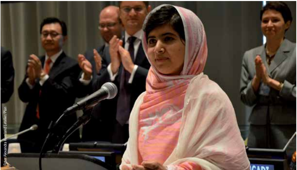
Friedensnobelpreisträgerin Malala Yousafzai bei der Jugendversammlung der Vereinten Nationen 2013 in New York.

„Wir können unsere Stimme erheben, aber nicht allein, sondern nur als Gruppe. Theaterstücke und Musik transportieren Botschaften [...] Man braucht dafür Mut und Selbstvertrauen – das bekommt man durch die Gruppe. Wenn man direkt mit den eigenen Eltern spricht, werden sie sagen, dass man ihre Autorität untergraben will. Doch wenn die Botschaft von einer anderen Person kommt, werden die Eltern sie anhören.“ Mädchen zwischen 16 und 19 Jahren aus Uganda. 18