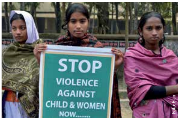
Mädchen in Bangladesch demonstrieren gegen Gewalt an Kindern und Frauen und für die Bestrafung der Täter.

Nhon, ein Junge aus einer ländlichen Region in Vietnam