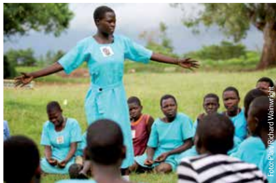
Eine Gruppe von Jugendlichen in Uganda, die sich für die speziellen Belange von Mädchen an Schulen einsetzt.

Information und Bildung sind ein wichtiger erster Schritt auf dem Weg zur Mitbestimmung. Mädchen müssen zuerst einmal ihre Rechte kennen, bevor sie sie einfordern können. Wenn diese Rechte in Gesetzen verankert sind und von Regierungen, Gemeinden und Familien unterstützt werden – und wenn genügend Ressourcen und politischer Wille hinter diesen Gesetzen stehen –, dann sind Gesetze ein äußerst mächtiges und wertvolles Instrument, um mehr Gleichberechtigung zu fördern.