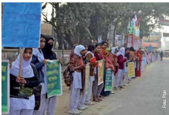
Demonstration gegen Gewalt an Frauen, Bangladesch, 2013

Mädchen glauben oft, dass die ihnen zugewiesenen Rollen, zum Beispiel Kinderbetreuung, Putzen oder Geschirrspülen, nicht hinterfragt werden können oder dass sie diese Aufgaben verdient haben. Doch nicht nur die Mädchen selbst haben das Gefühl, dass sie diese Rollen nicht ablegen können (das heißt, dass sie nicht die Macht dazu haben), häufig teilen ihre Mütter, Freundinnen und Lehrerinnen diese Auffassung. Dieses Rollenverständnis führt oft dazu, dass Gewalt gegen Frauen und Mädchen in Familien, Gemeinden, Schulen, Medien und an anderen Orten vielfach toleriert wird. Sie wird erwartet und erscheint normal. Wir sehen sie im Fernsehen, in den Medien, im Internet und selbst zwischen Menschen, die wir kennen.