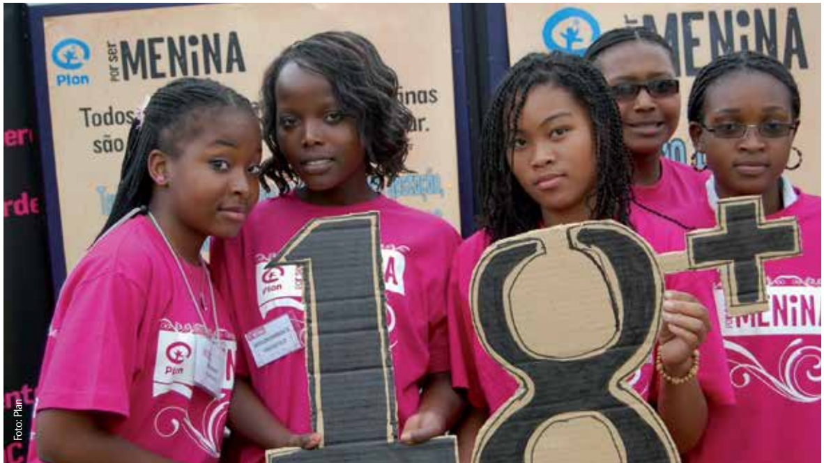
Junge Aktivistinnen gegen Kinderheirat, Brasilien

http://www.men-care.org/Educate-Yourself.aspx