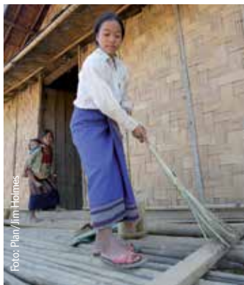
Mädchen bei ihren häuslichen Aufgaben, Laos

Wann ist dir zum ersten Mal bewusst geworden, dass etwas von dir erwartet wird, weil du ein Mädchen oder ein Junge bist? Hattest du das Gefühl, dass du dabei ein Mitspracherecht hattest? Gab es jemanden, an den du dich wenden konntest, wenn du Hilfe gebraucht hast?