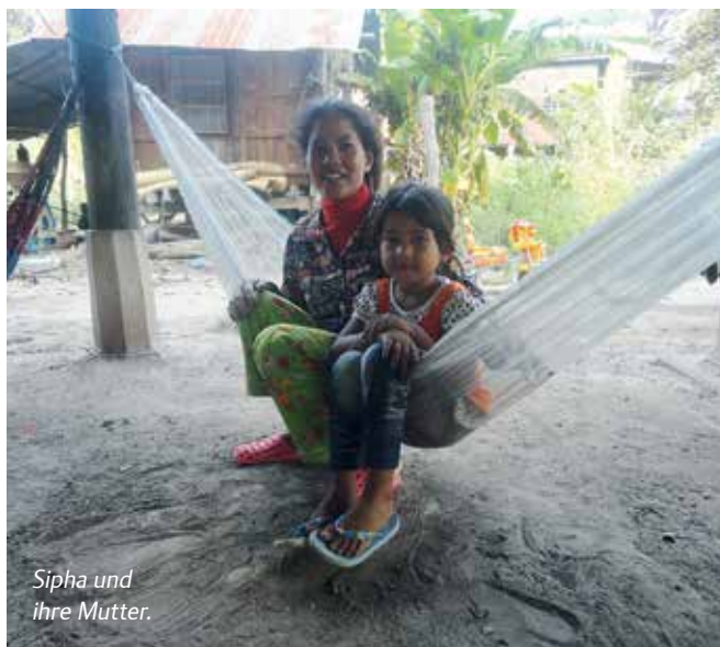
Sipha und ihre Mutter.