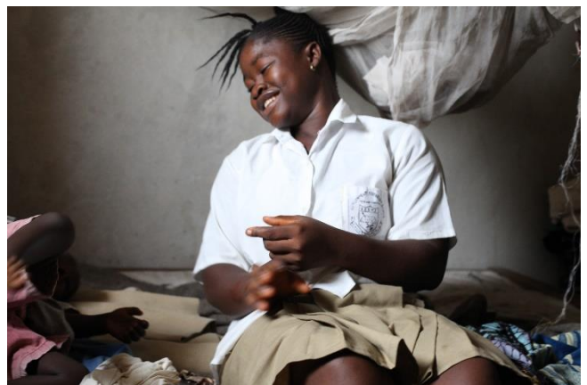
Selina (Name geändert), 17, wurde mit 14 verheiratet, nachdem sie aufgrund des Todes ihrer Mutter die Schule verließ. Als sie schwanger wurde, verließ ihr Mann sie. Sie zog zu ihrer Tante und verkaufte Kartoffeln auf dem Markt. Als sie genug Geld gespart hatte, begann sie wieder zu Schule zu gehen. Nach wie vor verkauft sie Kartoffeln auf dem Markt, geht zur Schule und kümmert sich um ihren Sohn.

Armut spielt eine große Rolle. Da eine Hochzeit sehr viel Geld kostet, können sich ärmere Familien eine Feier nicht leisten. Laut einer Studie, finden daher zum Beispiel in Mali Massenhochzeiten mit bis zu 300 Paaren gleichzeitig statt. Diese werden zum Teil auch von Unternehmen wie Parfüm-Herstellern finanziert.