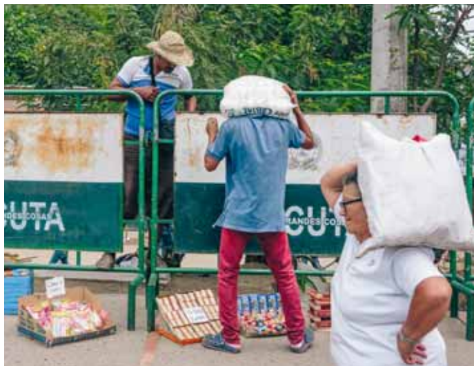
Entlang der Grenzlinie floriert auf kolumbianischer Seite der Straßenverkauf.

Dahinter liegt ein riesiger Straßenmarkt mit Erstversorgungswaren: Reis, Mehl, Trockenmilch, Wasser, Zucker, Medikamenten von Blutdrucksenkern bis Insulin.