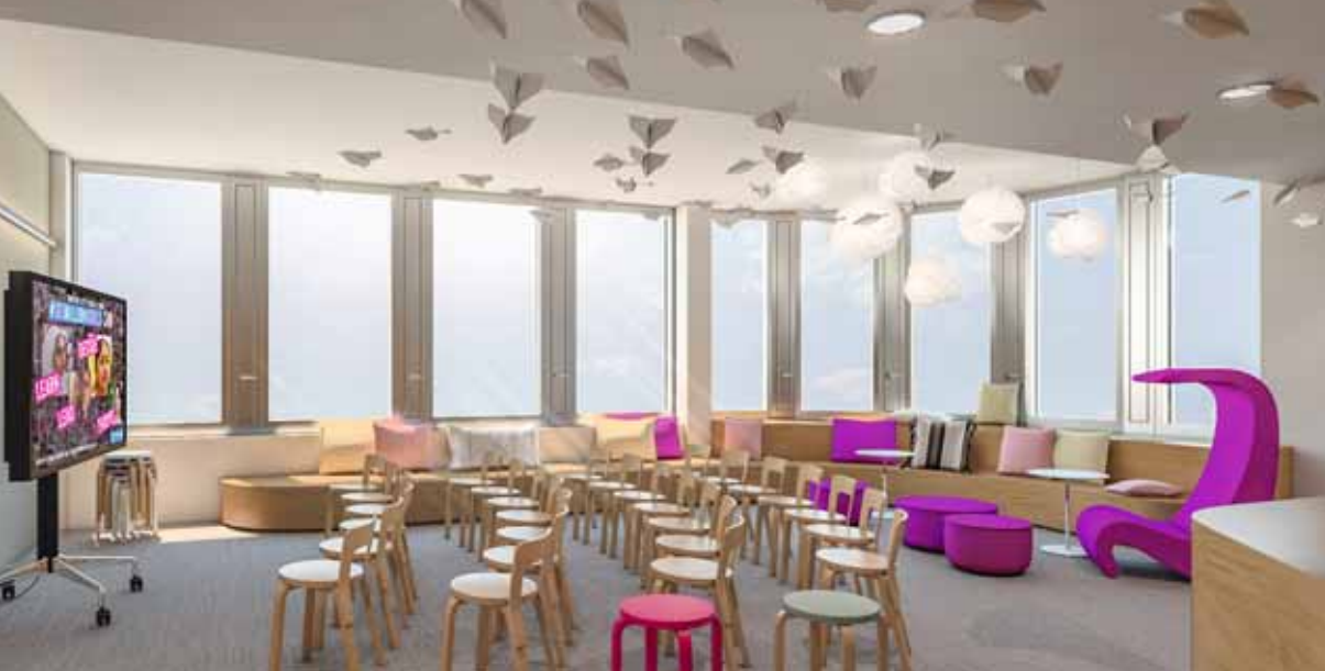
Neues Haus, neuer Konferenzraum – und unter der Decke das globale Kunstprojekt „Plan beflügelt“.