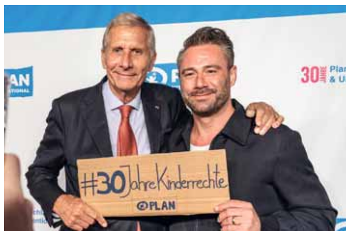
Zwei Plan-Paten setzen ein Zeichen für die Kinderrechte: Ulrich Wickert und Musiker Sasha.

Mehr Fotos von der Preisverleihung und Videos zu den Siegerbeiträgen finden Sie online auf www.plan.de/uwp2019 , Meilensteine sowie Grüße rund um das Plan-Jubiläum auf www.plan.de/30jahre .