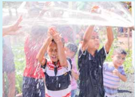
Wasser ab – in drei Gemeinden im Nordosten Brasiliens.