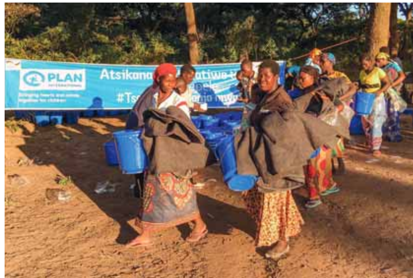
Plans Nothilfe erreicht betroffene Familien in Malawi.

Wir von Plan International leisten seit der Naturkatastrophe Nothilfe. Mit finanzieller Unterstützung von Spenderinnen und Spendern – unter anderem aus Deutschland und Österreich – haben wir Hunderte Menschen aus den Fluten gerettet. Im Rahmen eines vom Auswärtigen Amt finanzierten Nothilfeprojektes haben wir außerdem in Malawi 63 Kinderbetreuungsgruppen unter anderem mit Trainings für Betreuungskräfte unterstützt; in Simbabwe haben wir sechs Schutzräume in Notunterkünften eingerichtet, in denen Kinder spielen und psychosoziale Betreuung erhalten können. Tausende Familien erhielten Decken, Moskitonetze, Kochutensilien oder Hygieneartikel wie Zahnbürsten und Binden. Inzwischen wirken wir von Plan International auch bei der Sanierung zerstörter Wasserstellen mit. Mit Schulungen zu Kinderrechten und Hygiene verbessern wir außerdem den Schutz von Mädchen und Jungen in Krisensituationen. Aufbauend auf der bisherigen Soforthilfe bereiten wir weitere Maßnahmen in den betroffenen afrikanischen Partnerländern vor – für den Wiederaufbau von Schulen sowie Wasser- und Sanitäreinrichtungen.