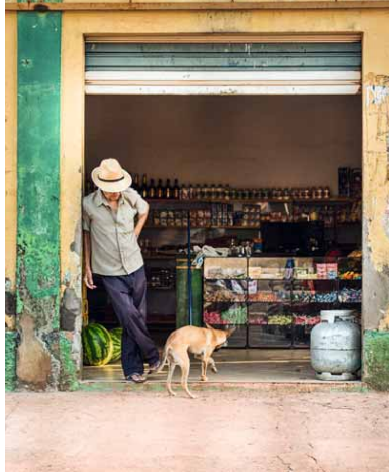
Der Nordosten ist eine der ärmsten Regionen Brasiliens.

Brasilien ist das größte Land Südamerikas und das fünftgrößte der Erde. Vor allem im Süden gibt es